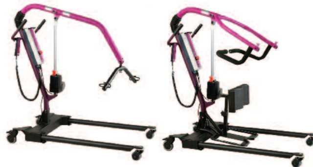
С приспособлением Stand-Up hoist-kit